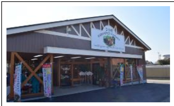
(株)タイム様 あじ横産直市場