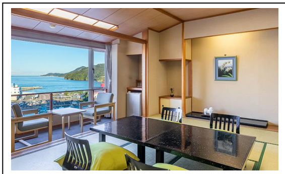
鳥羽温泉郷 「戸田家」